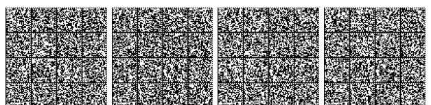
Tavola 2.3 Uso del suolo.

Tavola 2.2 Carta corografica del distretto idrografico del fiume Serchio.