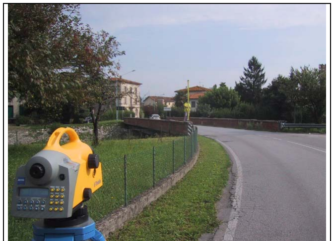
Caposaldo 6 – Km 18.3 SS12 Sommità parapetto ponte per Montuolo