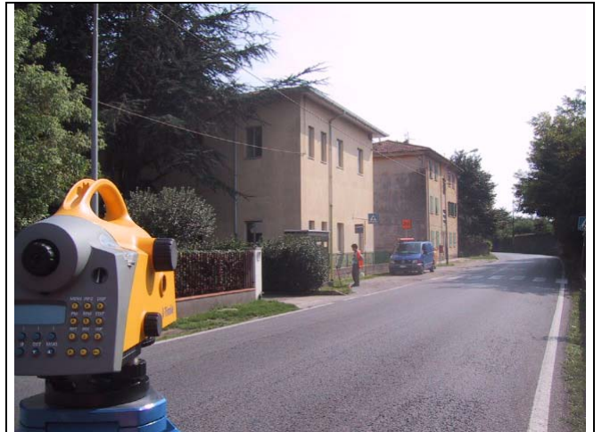
Caposaldo 2 - Km 14.2 SS12 Basamento Gas davanti scuola