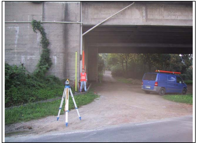
Caposaldo 4 – Km 16.1 SS12 Alla base della spalla ponte autostrada