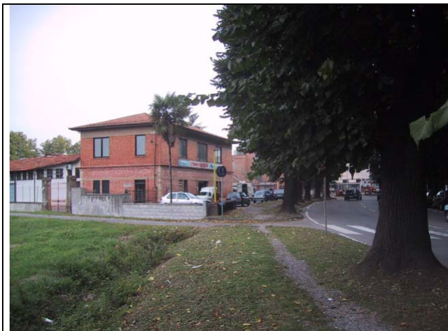
Caposaldo 11 Circonvallazione Lucca