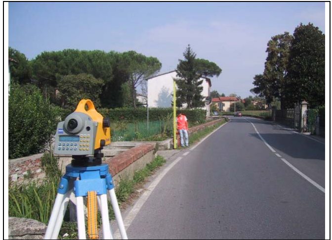
Caposaldo 8 – Km 19.9 SS12 Alla base del muro ponticello civico 2471