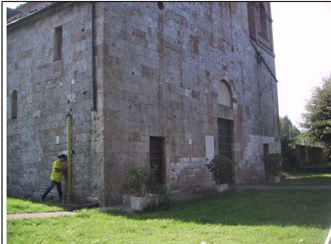
IGM Foglio 104 – Area Pisana - n°112 km 11 SS12 chiesa di San Marco