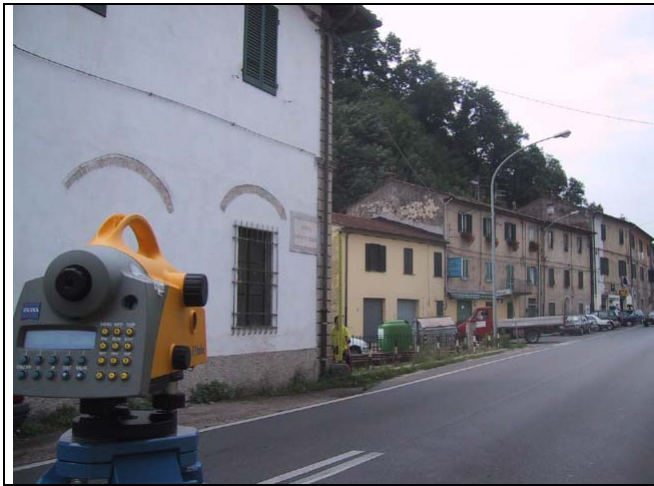
Caposaldo 3 – Km 15 SS12 Pietra angolo casa – incrocio via Fattori