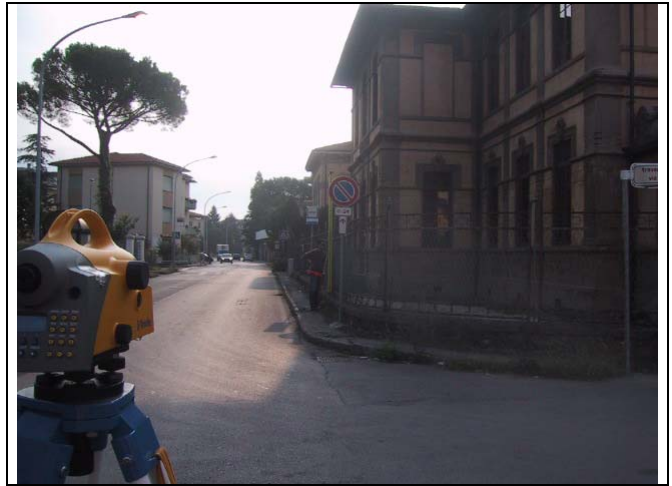
Caposaldo 10 Sommità muretto cinta villa angolo via Roana