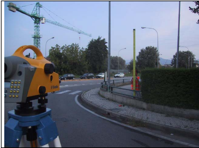
Caposaldo 9 – Km 21 SS12 Sommità muretto all'incrocio