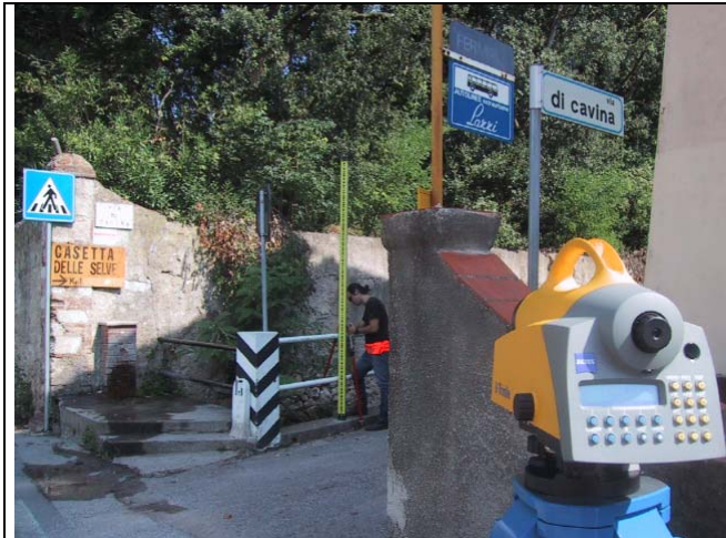
Caposaldo 1 – Km 13 SS12 Muro sostegno sx fosso vicino fontana