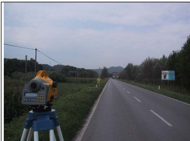
Caposaldo 5 – km 17.3 SS12 Tombino