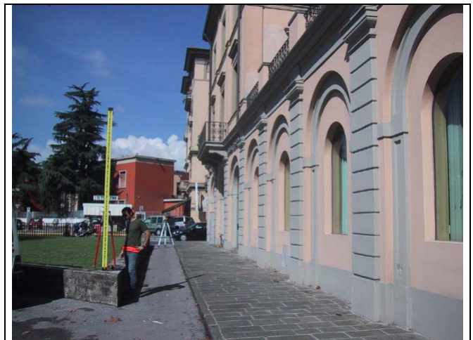
Caposaldo 12 Sopra muretto aiuola – Banca Toscana