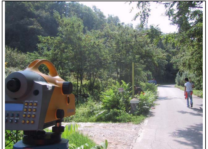
IGM Foglio 104 – Area Pisana - n°113 Km 0.2 strada 4 venti – Molino di Quosa